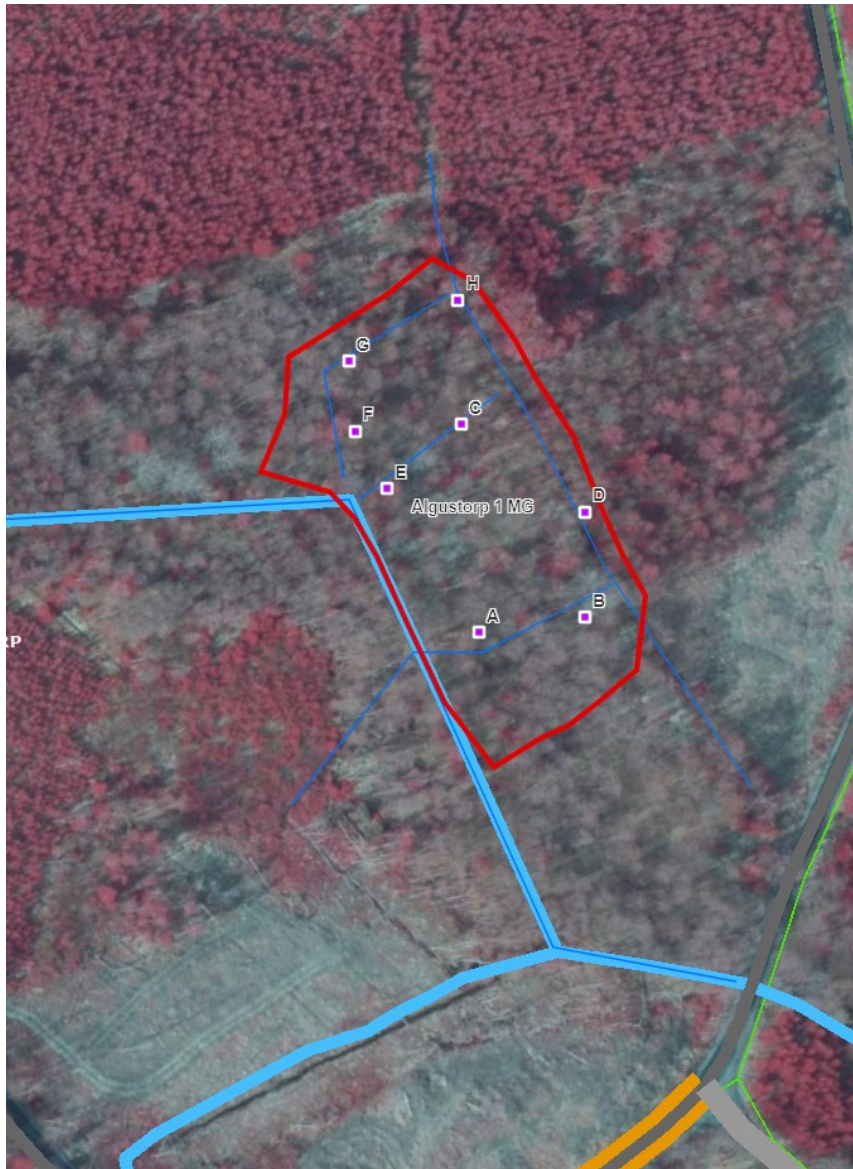
Ortofoto på ÅV objekt 0,83 hektar