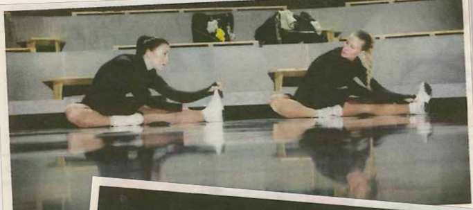
På isens kant möt skap och rivalitet