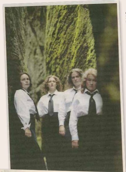
UTFLYKT TILL HANGING ROCK, VARBERGS TIDNING 11 FEBRUARI 2025