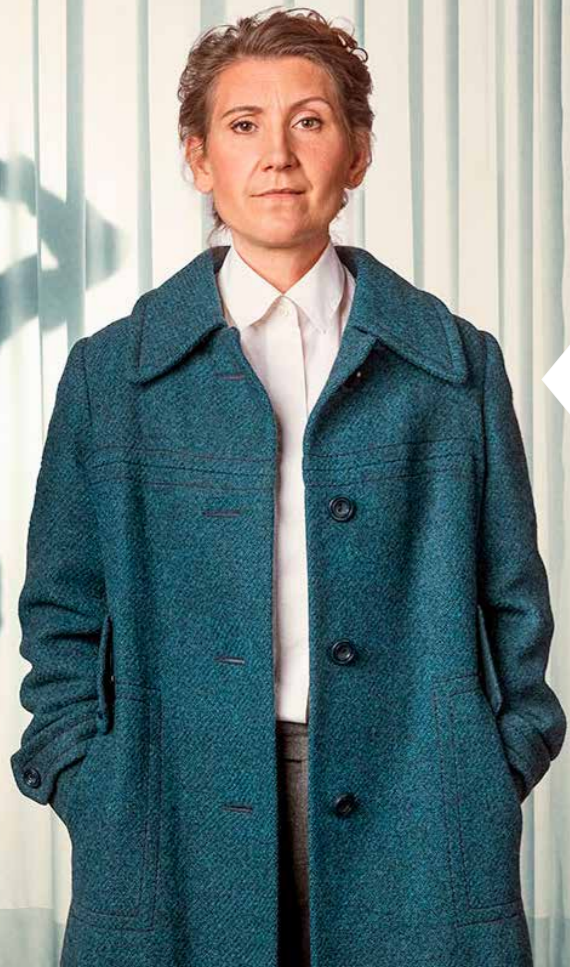
EGENMÄKTIGT FÖRFARANDE.