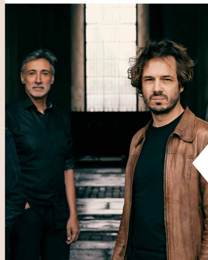
CANTO III.

SCEN: Stora Scen, Foajéscenen MÅLGRUPP: vuxna PUBLIK: 765 personer ANTAL FÖRESTÄLLNINGAR: 7