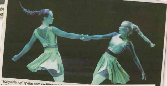
"Tonya Nancy" spelas som skolflickor