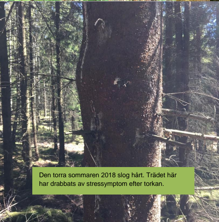
Den torra sommaren 2018 slog hårt. Trädet här har drabbats av stressymptom efter torkan.