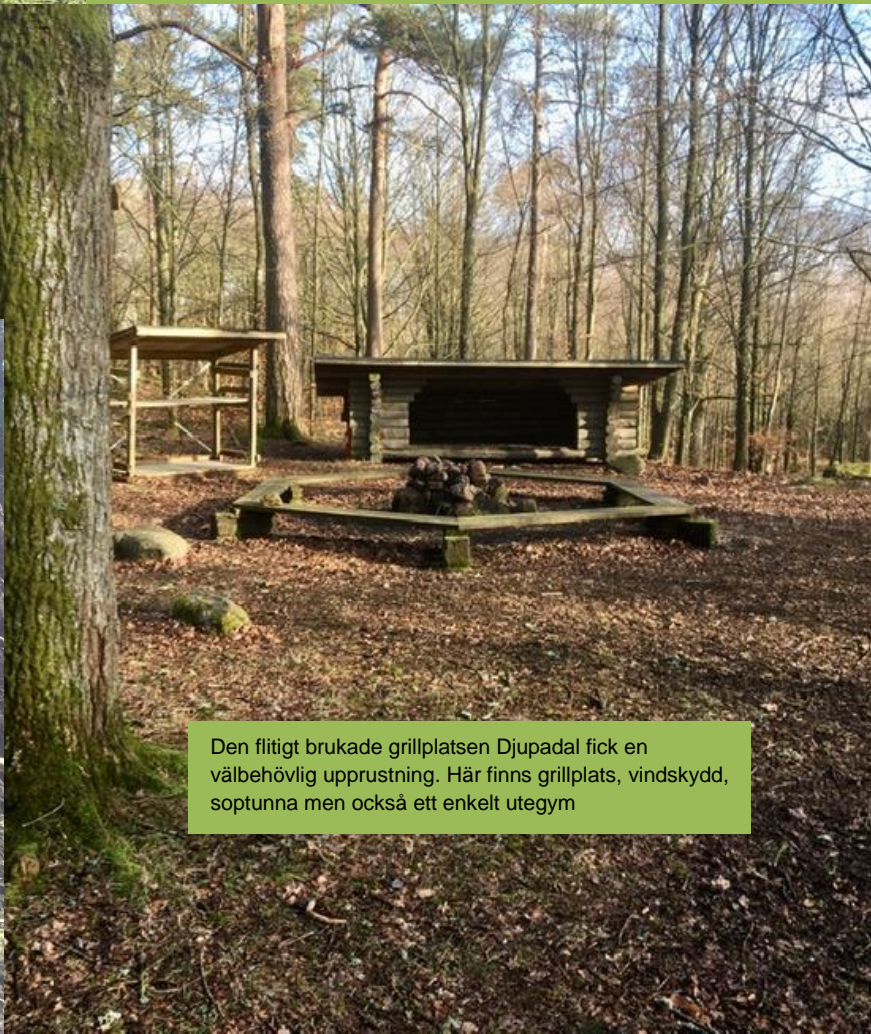
Den flitigt brukade grillplatsen Djupadal fick en välbehövlig upprustning. Här finns grillplats, vindskydd, soptunna men också ett enkelt utegym