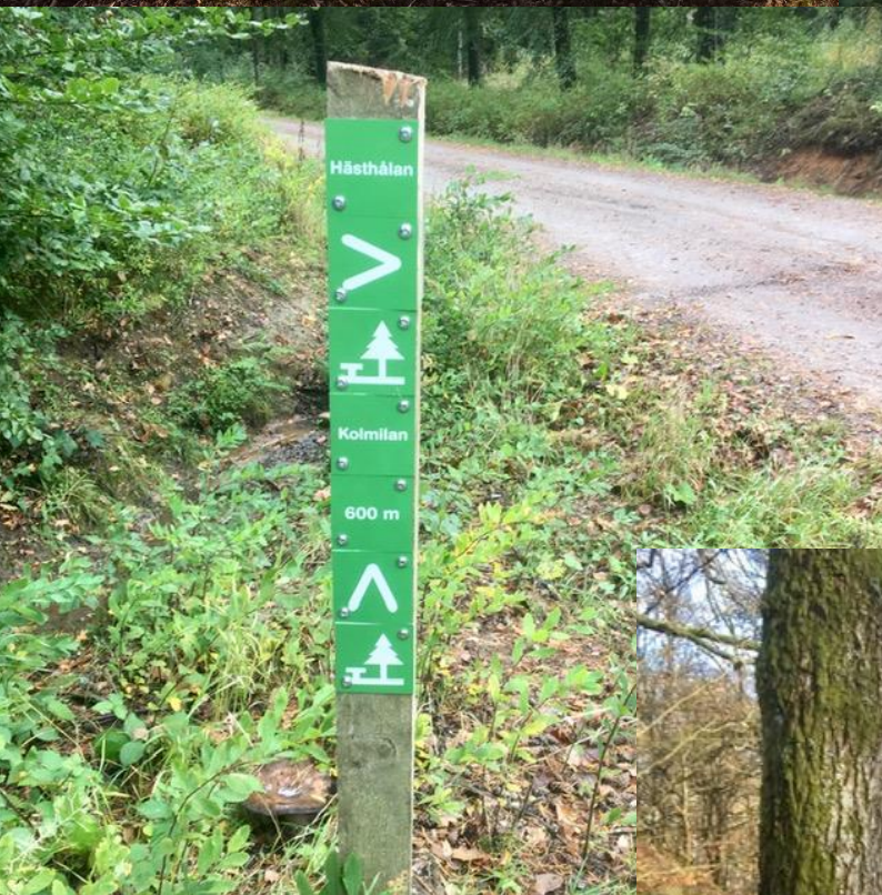
Ett nytt flexibelt skyltsystem etablerades som test på Plönningeskogen. Skylt och symbolsystemet har sin utgångspunkt i den nationella standardiseringen vilket ökar tillgänglighet och igenkänning för allmänheten..