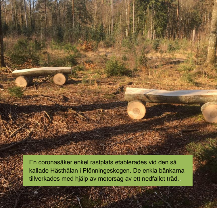
En coronasäker enkel rastplats etablerades vid den så kallade Hästhålan i Plönningeskogen. De enkla bänkarna tillverkades med hjälp av motorsåg av ett nedfallet träd..