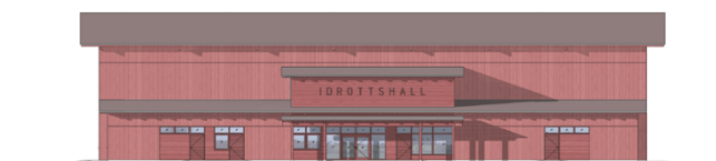
Fasad mot norr