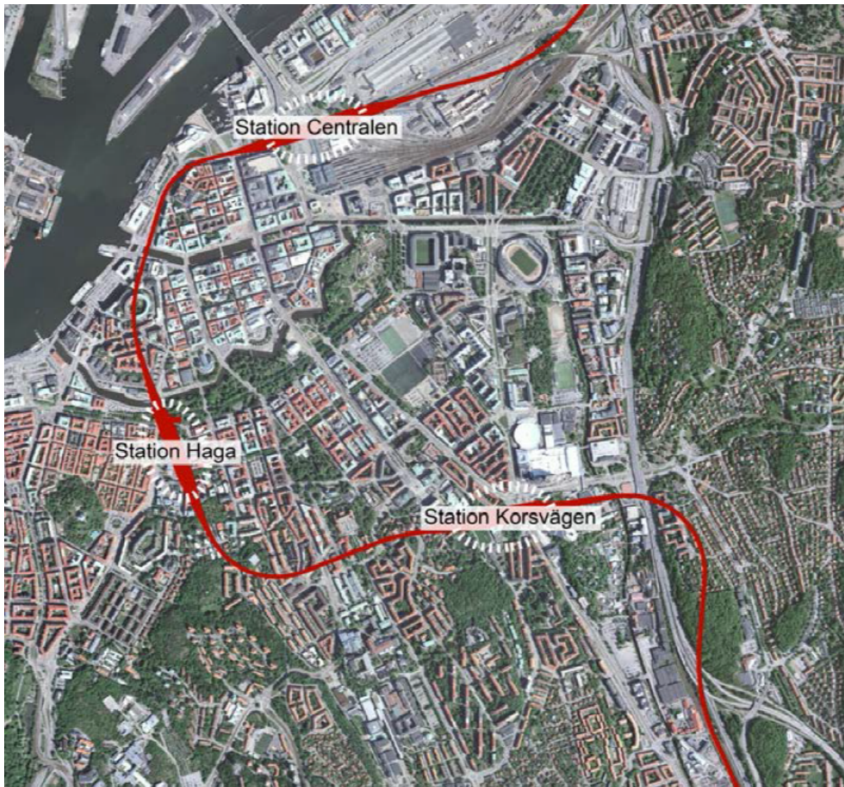
Bild 1: karta över Göteborg med de nya Västlänksstationerna Korsvägen, Haga och Göteborg C nedre.