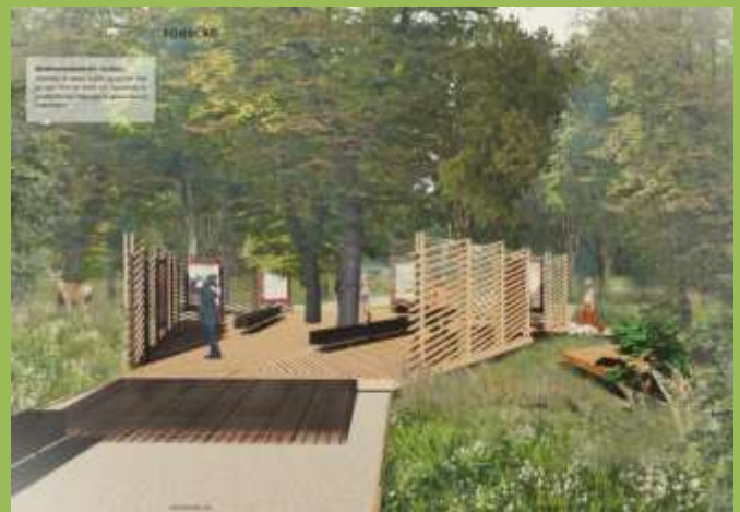
Plats för vindskydd

Trygghet är ett ständigt återkommande ord när besök i naturen diskuteras. Detta togs fasta på i den inbjudna tävling om standardiserade startplatser för besök i den Halländska naturen som genomfördes 2023. Vinnande koncept togs fram av Krook och Tjäder arkitekter och innebär att det etableras standardiserade informationsplatser vid varje punkt där besöket i naturen startar.