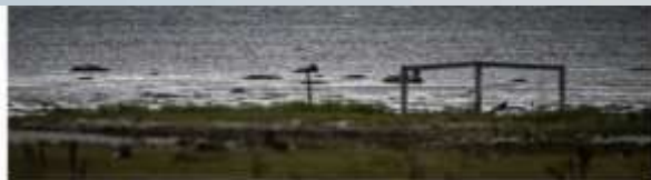
I Skogshy, mellan Laholm och Kåreel är det tänkt att anläggningen ska byggas.