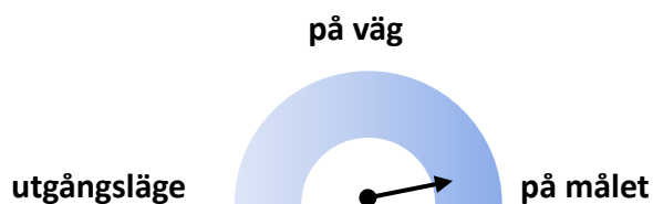
Figur 2. Bedömning av måluppfyllelse delmål 5

Region Halland bedöms inom detta delmål vara "på väg". För att Region Halland ska nå upp till den långsiktiga målnivån "på målet" till 2026 krävs att resultatet av Hållbart medarbetar-engagemang (HME) är större än 80 för hela Region Halland, vilket är 77 enligt senast tillgängliga siffror (2019).