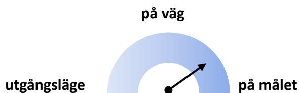
Figur 2. Illustration av måluppfyllelse delmål 3

Region Halland bedöms inom detta delmål vara "på väg mot målet". För att Region Halland ska nå upp till den långsiktiga målnivån "på målet" till 2026 krävs att andel tillsvidareanställda som byter tjänst internt av totalt antal som byter tjänst är större än 50 % för hela Region Halland, vilken är 41 % enligt Uppföljningsrapport 2 (2020). Det är en ökning med 4 % sedan 2019, vilket kan förklaras av att de interna avgångarna har ökat från slutet 2019, medan de externa avgångarna har planat ut. En klar majoritet av yrkesgrupperna visar en högre intern rörlighet, men det är yrkesgrupperna sjuksköterskor och administration/ledning som står för största delen av förändringen. Resultaten för intern rörlighet bör dock tolkas med viss försiktighet eftersom exempelvis organisatoriska förändringar påverkar resultatet.