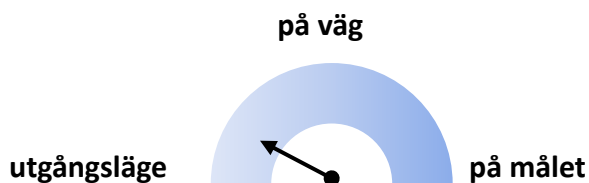
Figur 1. Illustration av måluppfyllelse delmål 1

Region Halland bedöms inom detta delmål vara "på väg mot målet". För att Region Halland ska nå upp till den långsiktiga målnivån "på målet" till 2026 krävs att andelen medarbetare som uppger att de har arbetsuppgifter som en annan personalkategori kan och bör utföra är mindre än 25 %, vilken är 51 % enligt senast tillgängliga siffror (2019).