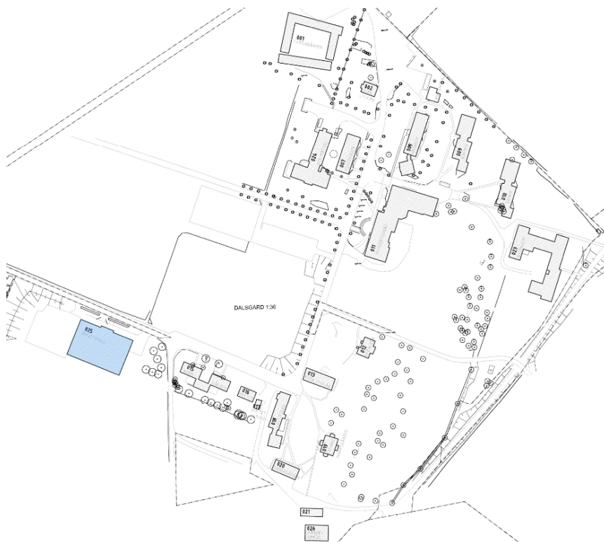
Figur 1. Översikt Katrinebergs folkhögskola, idrottshall markerad i blått.