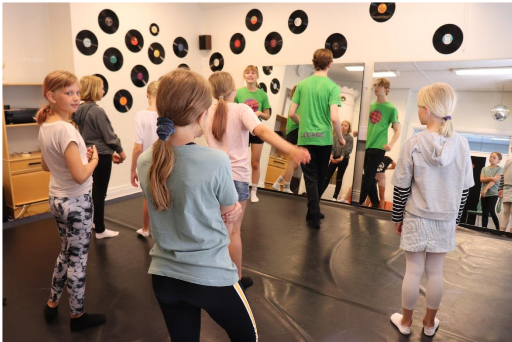
Danselever och ledare på Kultursommar 2020.

När vi körde igång Kultursommar båda veckorna så släppte vi på några till och det stannade på 34 barn totalt/vecka. Detta pga några blivit lovade plats, några som kom oanmält och några på reservlistan.