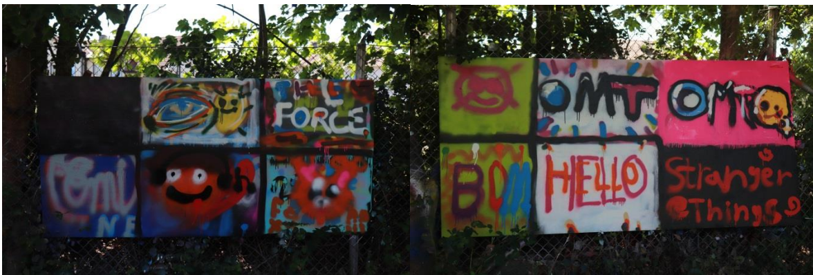
Några av de härliga graffitimålningarna gjorda av barnen under Kultursommar 2020.

Graffiti är en sak vi infört i Kultursommar och det var uppskattat, mer än hälften av barnen var med att prova att spraya motiv på våra upphängda graffitiväggar utomhus. Här blev det dock en mindre incident när en person sprayade sig själv i ögat med färgburken. Det var inte så mycket och det redde ut sig efter noggrann sköljning av ögat. Graffiti är en härlig konstform. Vi vidtar så klart säkerhetsåtgärder, med munskydd, handskar och förkläden. Dock så kan man aldrig helt garantera sig mot den mänskliga faktorn. Vi kommer definitivt fortsätta med Graffiti som inslag i Kultursommar.