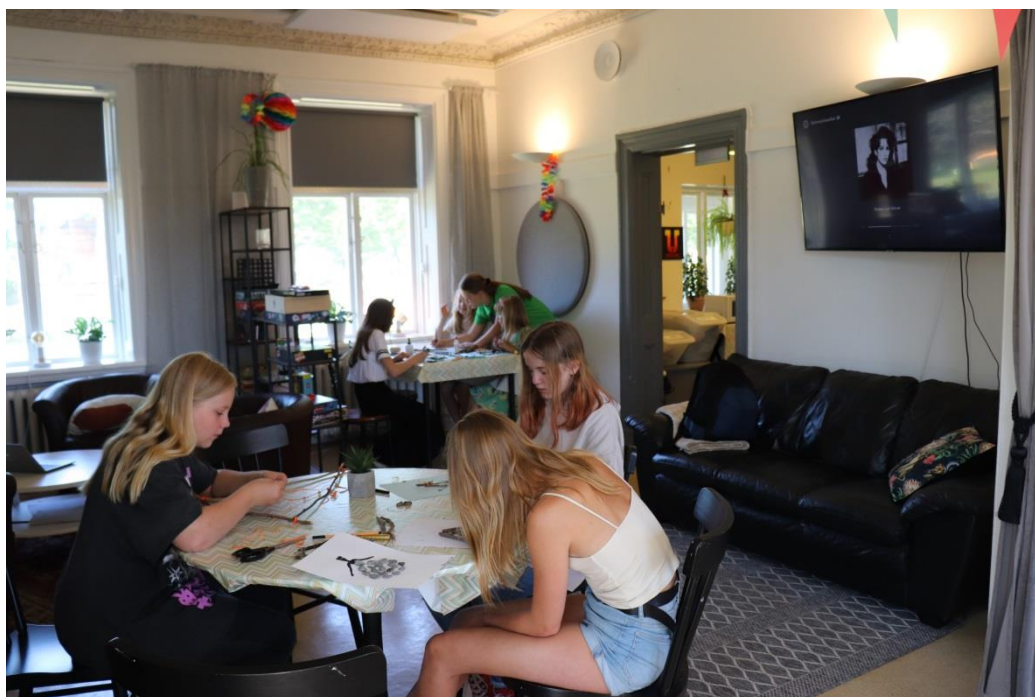
Bild & Form på Kultursommar.