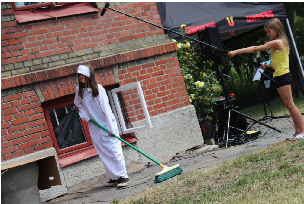
Teatergruppen spelar upp sin pjäs, Film & Foto är där och filmar.