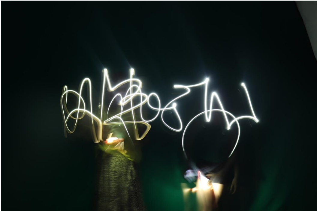
Ljusgraffiti – En lek med kamerans slutartider på Kultursommars Film & Foto.

Svårare danser för de som vill o vågar. Mer organiserat även på em på bilden