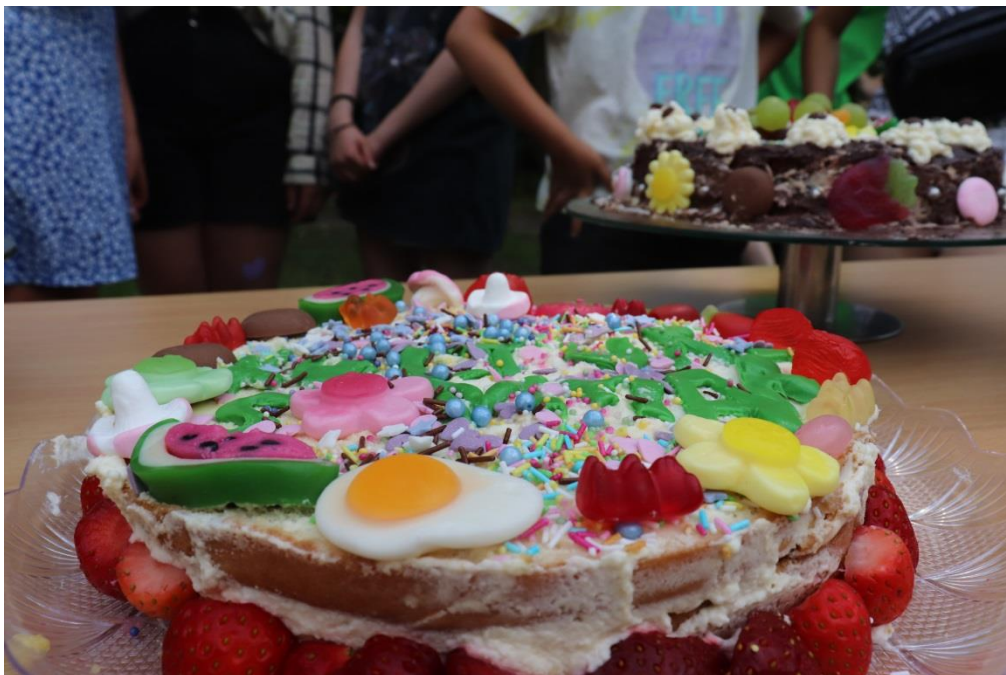
Tårtor dekorerade av deltagarna inför fredagens avslutning.