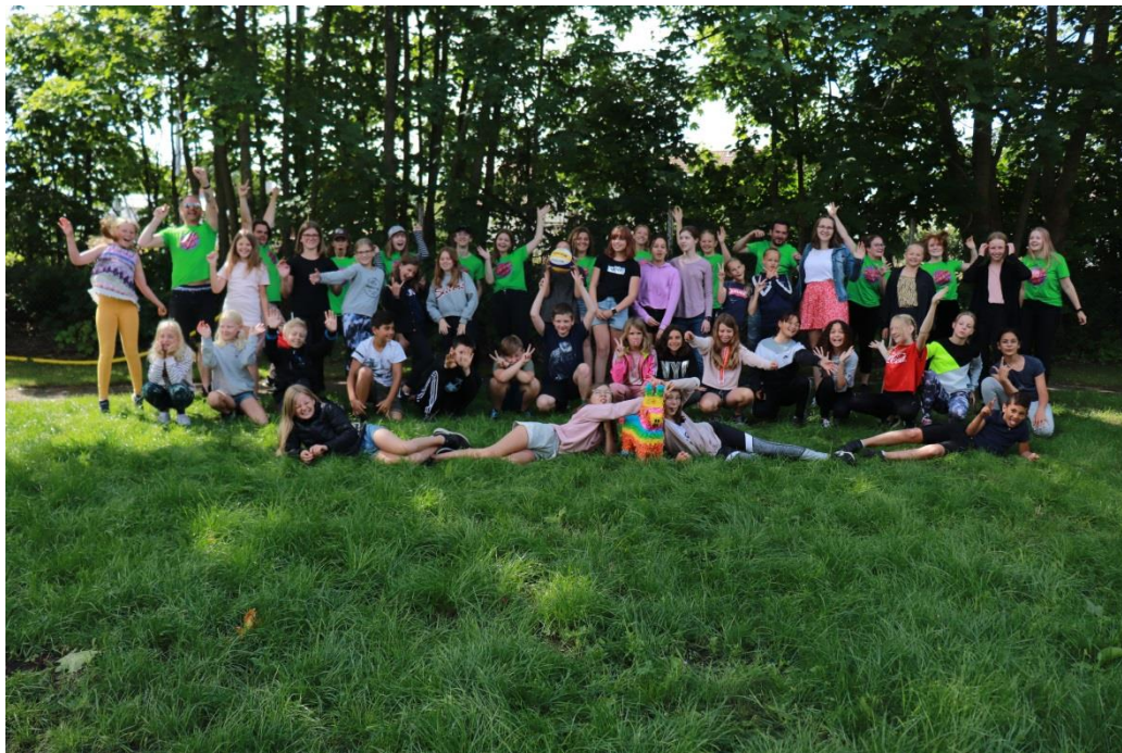
Ett gott och glatt gäng Kultursommardeltagare vecka 27.

34 barn genomförde Kultursommar vecka 27 fördelat på 28 tjejer och 6 killar.