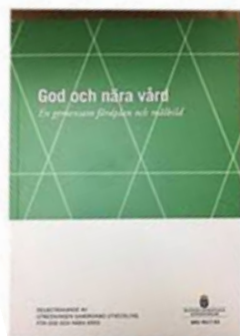
God och nära vård delbetänkande 1