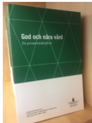
God och nära vård delbetänkande 2