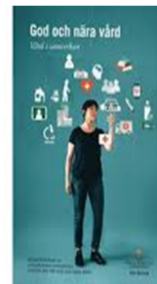
God och nära vård delbetänkande 3