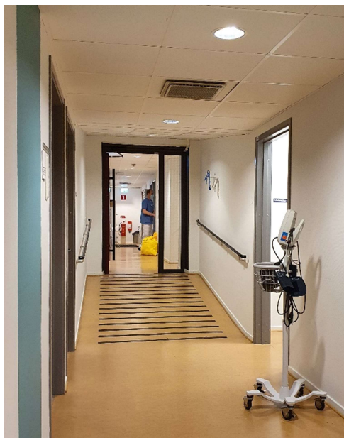
Olika golvnivåer på plan två. Vilplan saknas närmast dörrpartiet och lutningen är för stor.

Trapphuset har spiraltrappa vilket inte uppfyller kraven på utrymningsväg. Hissen har tröskel som är svårforcerad för rullstol och rollator.