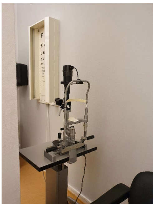
Ögonundersökning är inklämd mellan pelare och vägg.