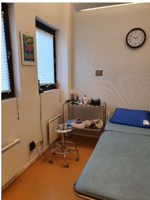
Flera av undersökningsrummen är för små.