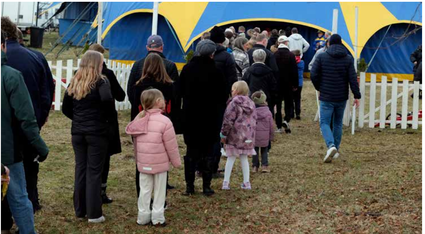
Kö till en av Cirkus Olympias två fullsatta föreställningar i Oskarström med drygt 4 000 invånare, 1 200 av dem besökte cirkusen.

Andra utomhusarrangörer kan däremot använda asfalterade ytor. Däremot stänger konstgräs ute alla former av kulturarrangemang, beroende på risken för skador på gräset.