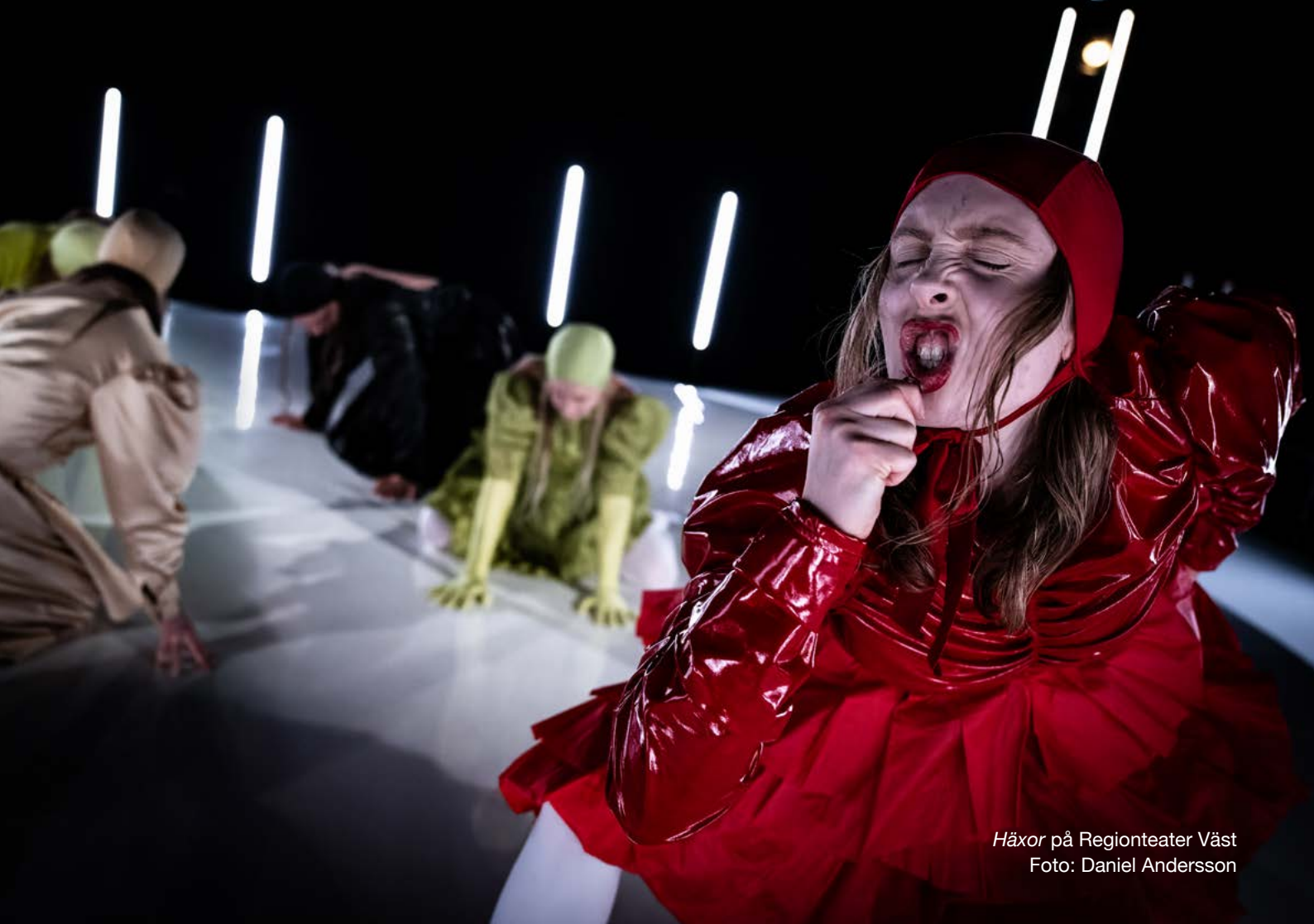
Häxor på Regionteater Väst