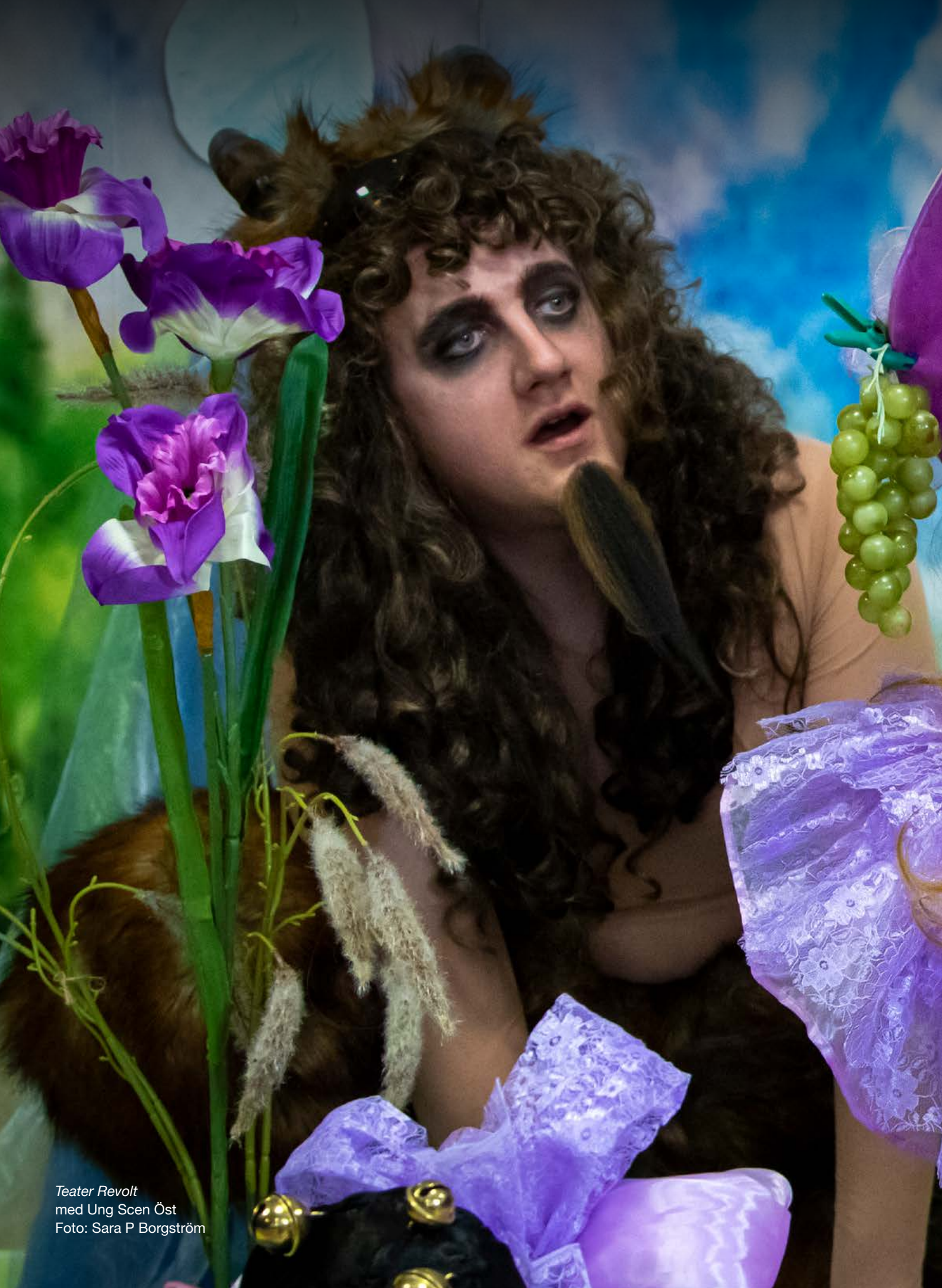
Teater Revolt med Ung Scen Öst