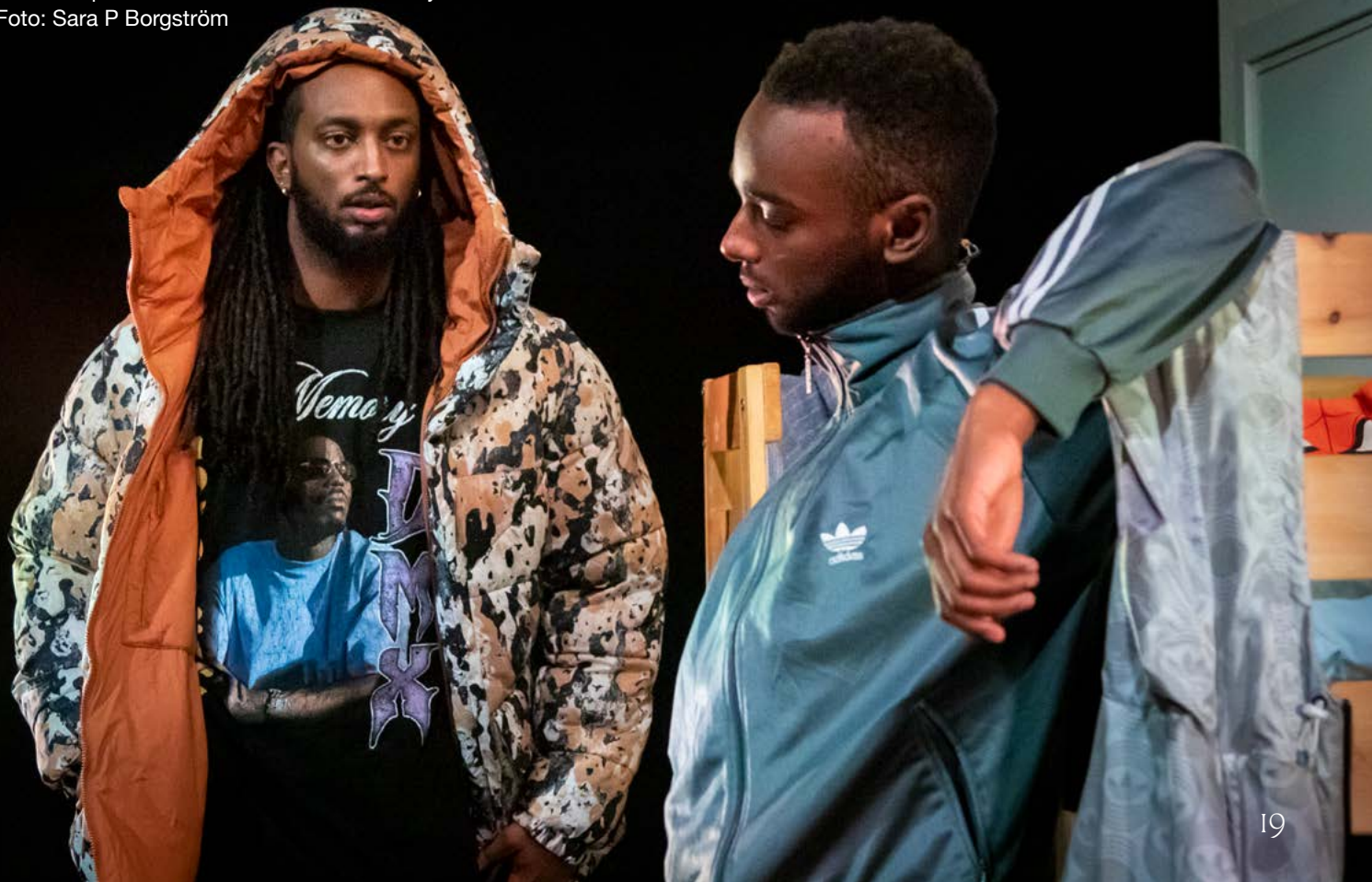
8 kvadrat på Kulturhuset Stadsteatern Husby