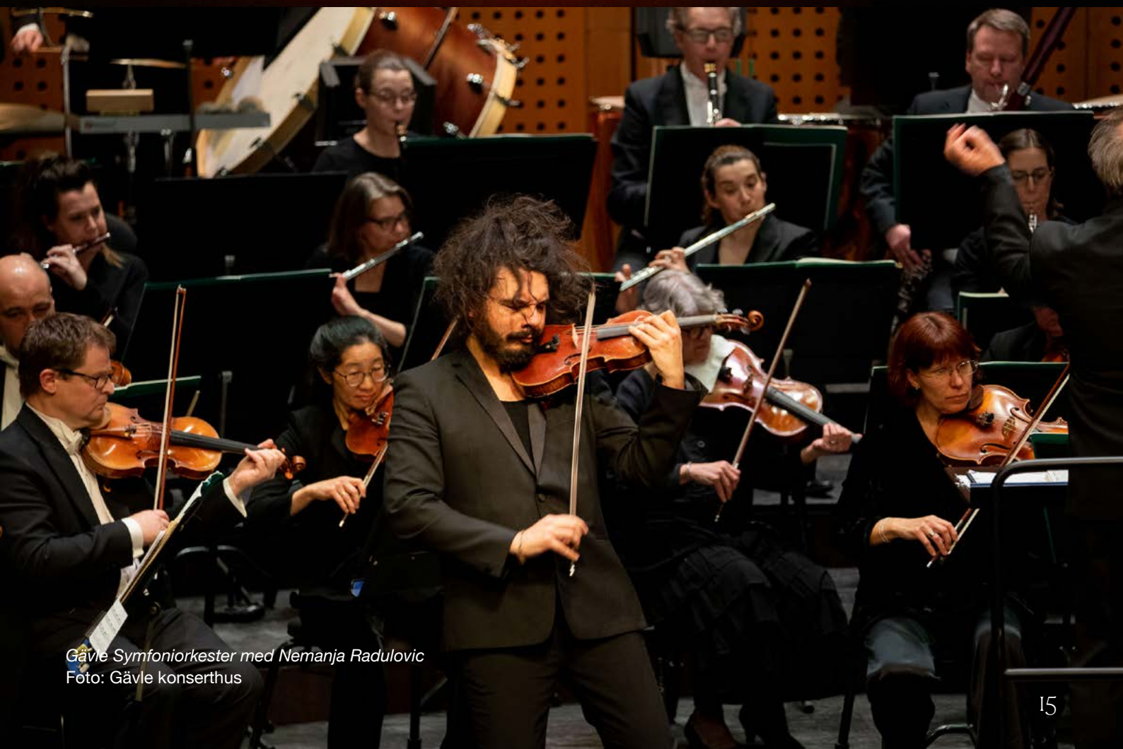
Gävle Symfoniorkester med Nemanja Radulovic