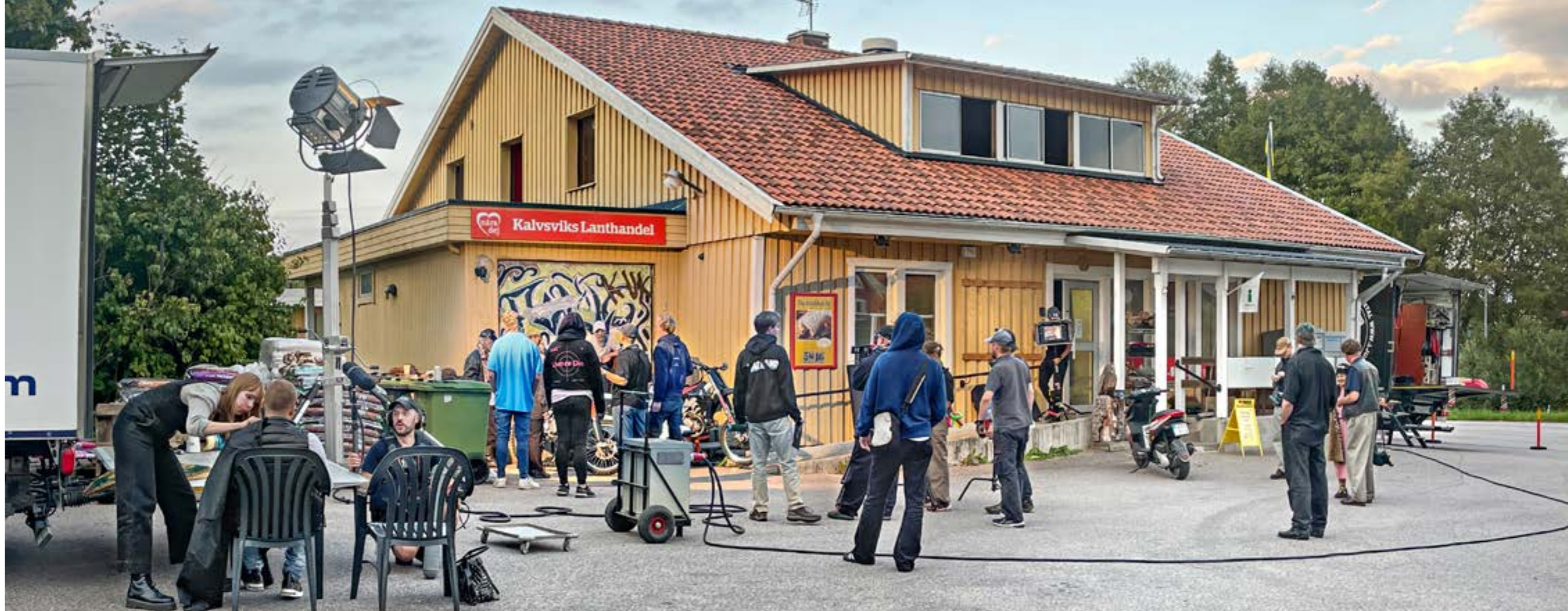
Filmspelning av "Stugan" i Kalvsvik, Kronoberg. Produktionsbolag: Pine.