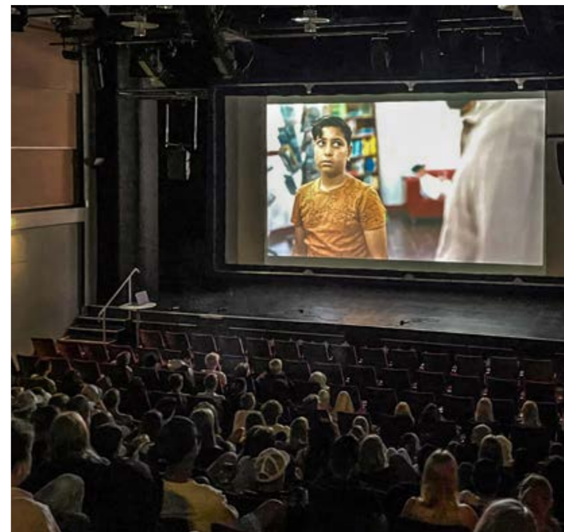
"Bullets" var en av filmerna som visades i Olofström och blev mycket uppskattad.

Kalmareleverna såg "Mina bröder och jag" på Biostaden, och i Oskarshamn visades "Utvandrarna" vid fyra tillfällen på Sagabiografen.