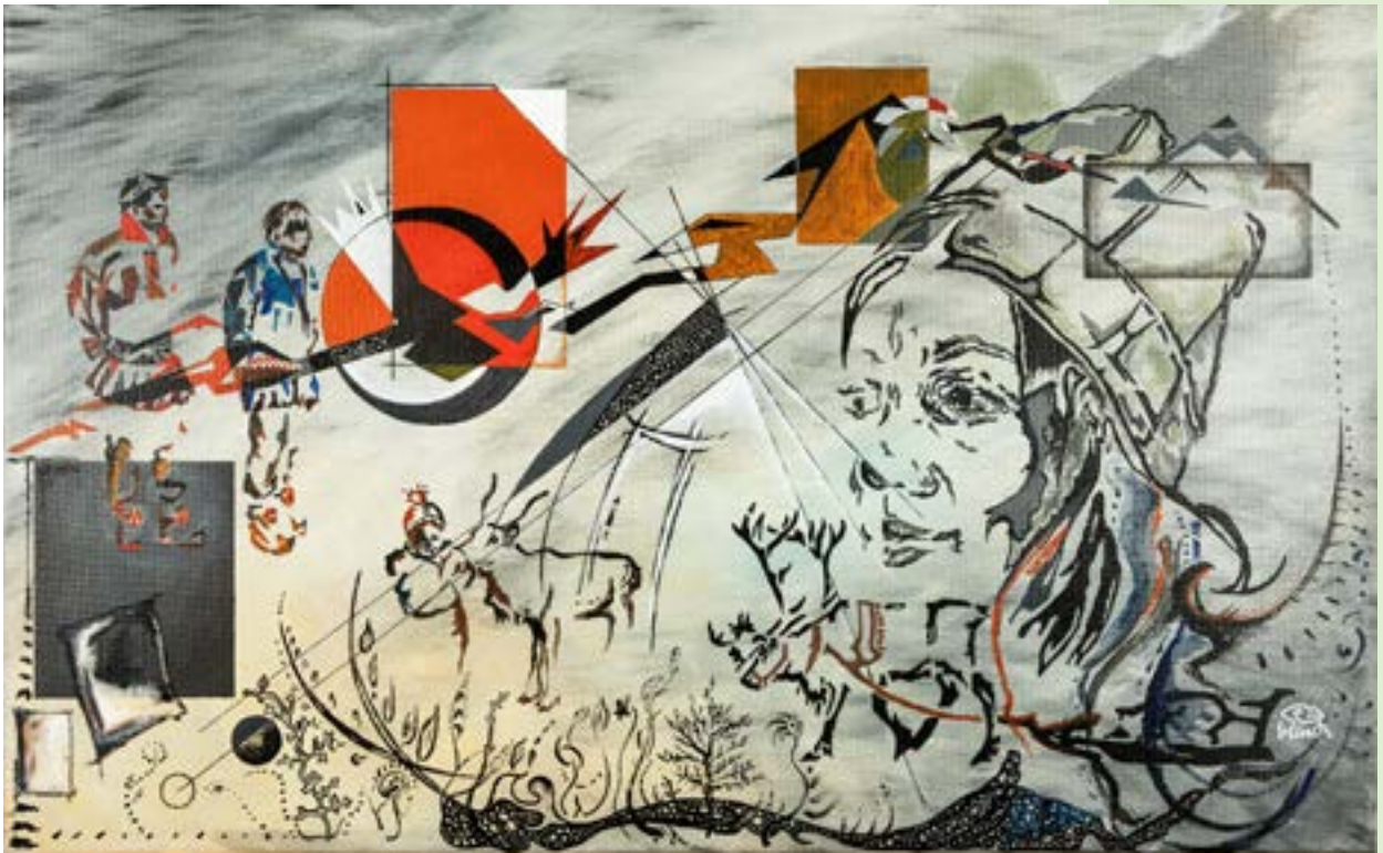
»MINORITET I MINORITETER«

och bedriver verksamhet i hela Saepmie, nationell och internationellt. Det är en betydande samisk institution och verksamheten uppfattas som en tydlig part för frågor relaterade till det samiska samhället. Regionen ser positivt på stiftelsens arbete för att bli ett nationellt centrum för sydsamisk kultur, näring och språk samt för att etablera ett samiskt museum i sydsamiskt område. Gaaltije erhåller verksamhetsbidrag från Region Jämtland Härjedalen. Utifrån dialog tas ett årligt avtal fram där man gemensamt identifierar angelägna insatser.