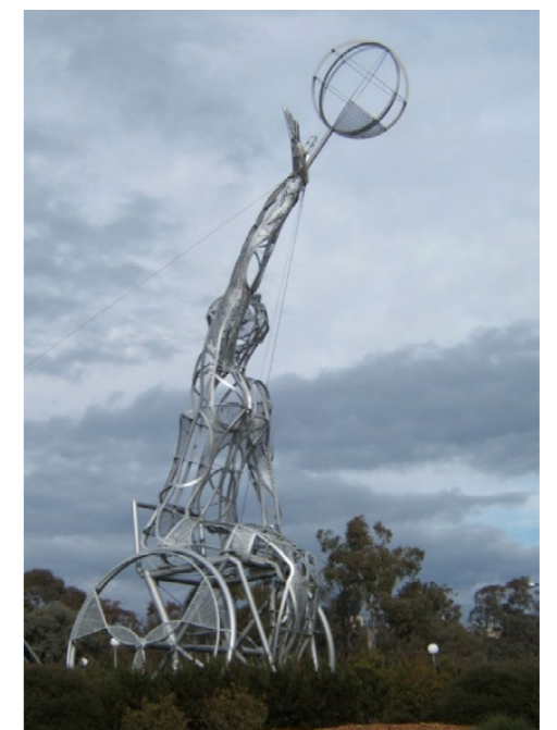
Ramverk av basketspelare, vid Institute of sports, Australien.