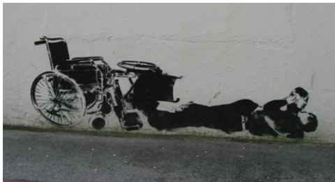
07 - Den norska graffitikonstnären Dolk har målat flera kända muralverk på temat funktionsnedsättning, till exempel i Bergen och på Lofoten. "Wheel Chair lovers" och "Somnambulo" är två av dessa verk.