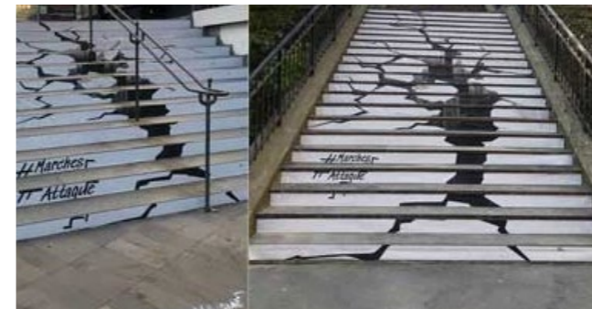
10 - APF France handicap skapade en kampanj där de genom att måla trappor så att de såg förstörda ut ville belysa hur otillgängliga gatorna är för personer med rörelsehinder. Kampanjen utfördes 2021 i Paris, Lyon, Brest och Marseille.