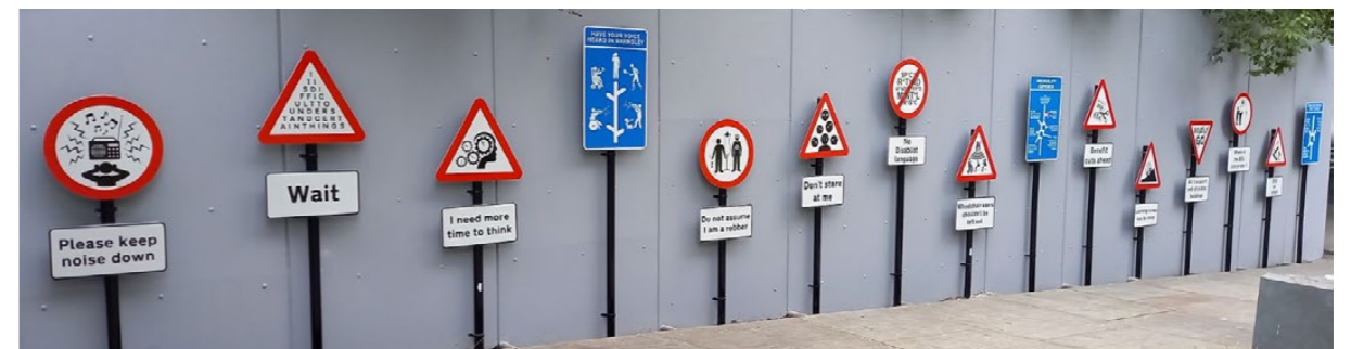
11 - "The Way Ahead" av Caroline Cardus 2004 är en serie vägs skyltar som gestaltar vardagliga orättvisor som hon upplevde som rullstolsbrukare. https://barnsleycivic.co.uk/way-ahead/