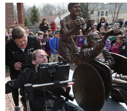
Staty med pappa som med sin son sprang Boston marathon, USA.