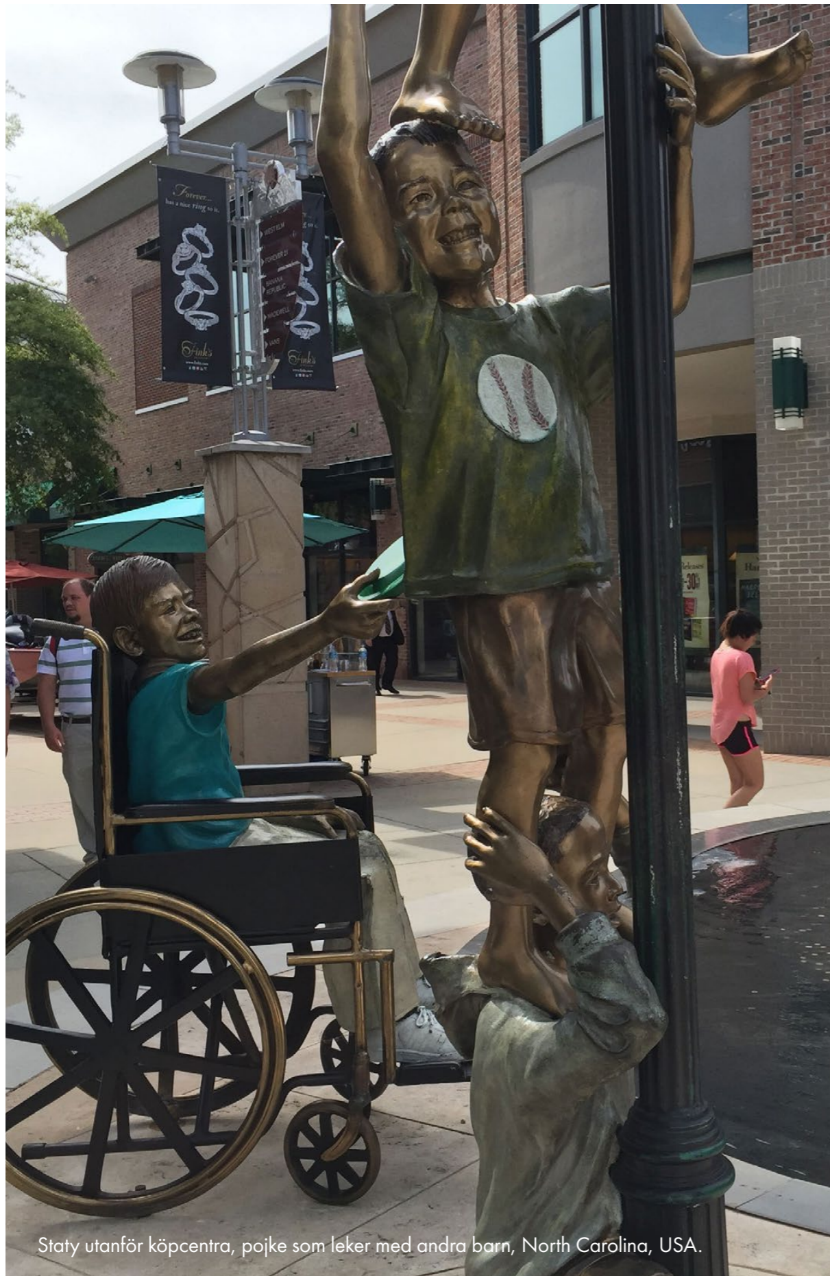
Staty utanför köpcentra, pojke som leker med andra barn, North Carolina, USA.