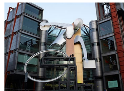
Installation inför Paralympics, Storbritanien.