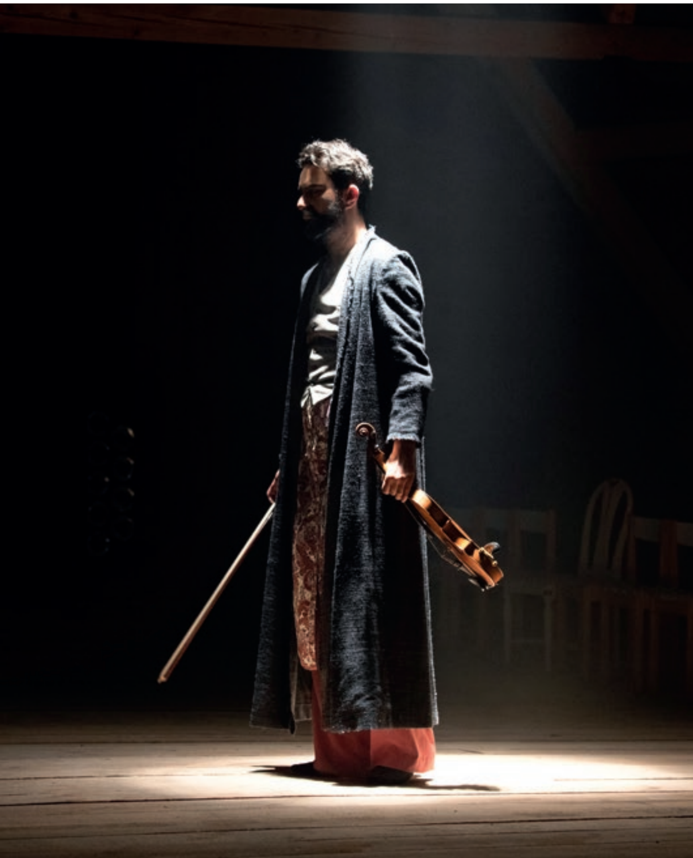
Scenkonst Sörmlands föreställning Tre Systrar , av Anton Tjechov på Idéfarmen i Dunker Lundby, Malmköping.