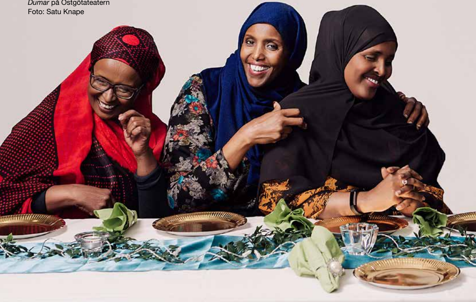
Dumar på Östgötateatern