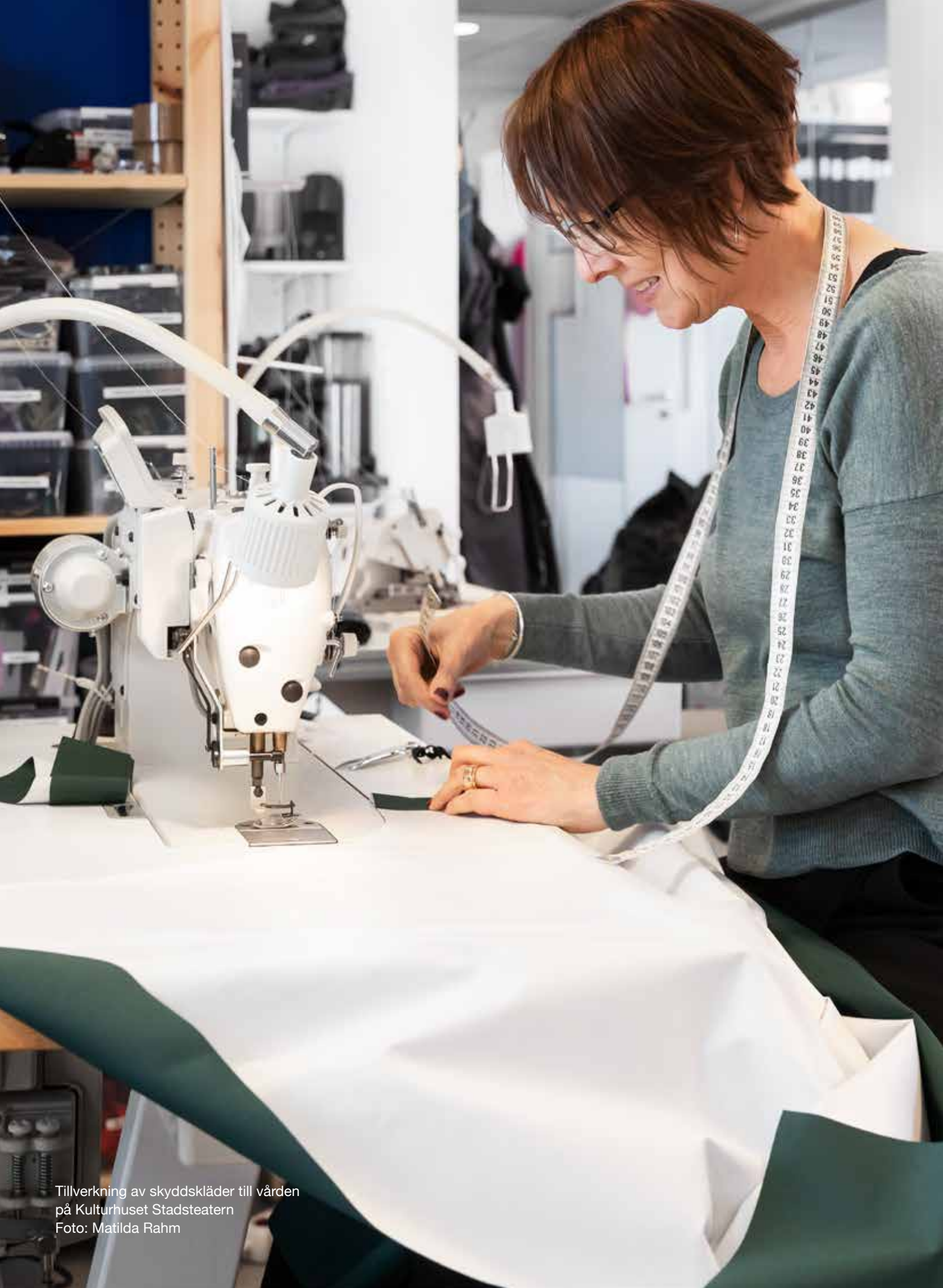
Tillverkning av skyddskläder till vården på Kulturhuset Stadsteatern