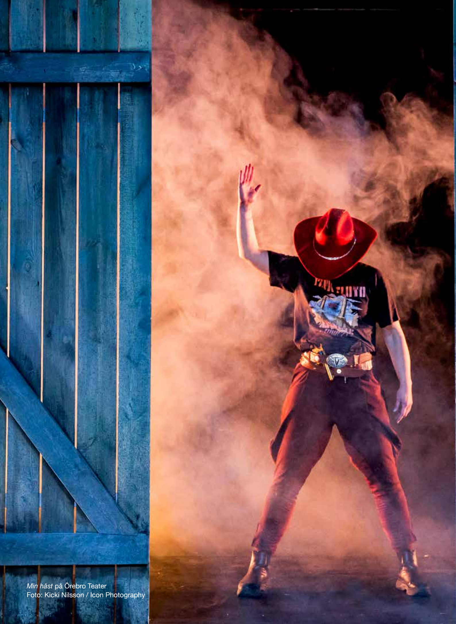
Min häst på Örebro Teater