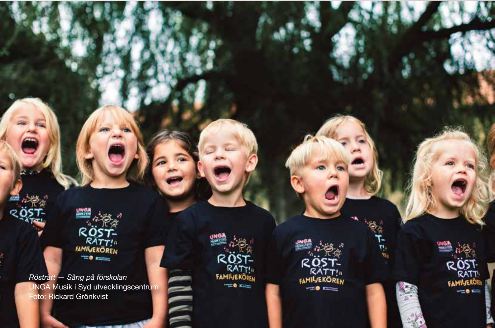
Rösträtt — Sång på förskolan UNGA Musik i Syd utvecklingscentrum