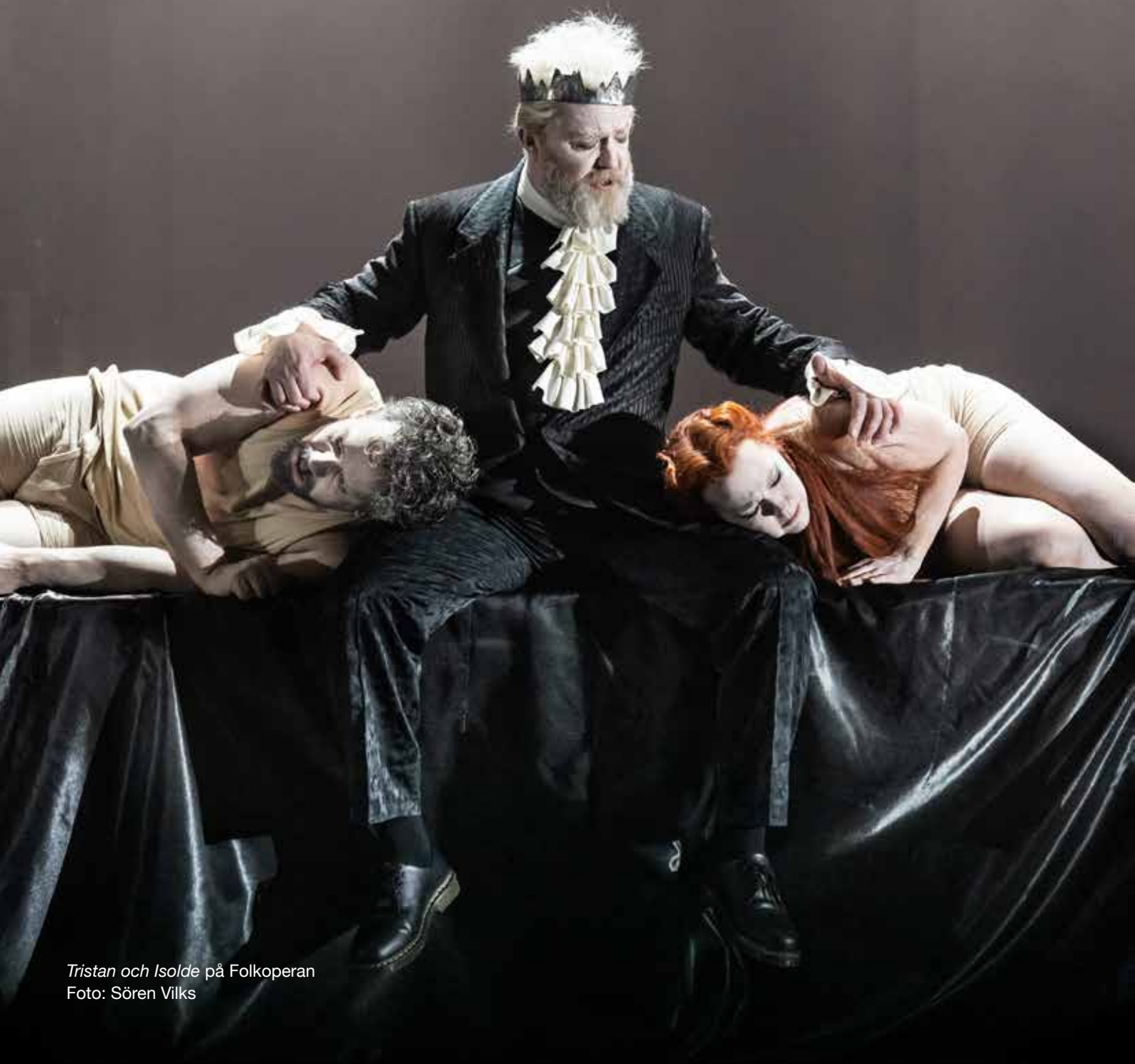
Tristan och Isolde på Folkoperan

En av våra viktigaste uppgifter är att svara på remisser och bidra med relevanta synpunkter inför politiska beslut. Det är ett effektivt sätt att påverka å medlemmarnas vägnar. Under året bedrev vi ett intensivt arbete med att svara på remisser till såväl departement som myndigheter. Det har varit stort fokus på remissvar kring coronakrisen. Här sammanfattas några av våra remissvar.