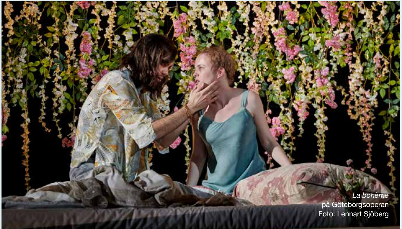
La bohème på Göteborgsoperan