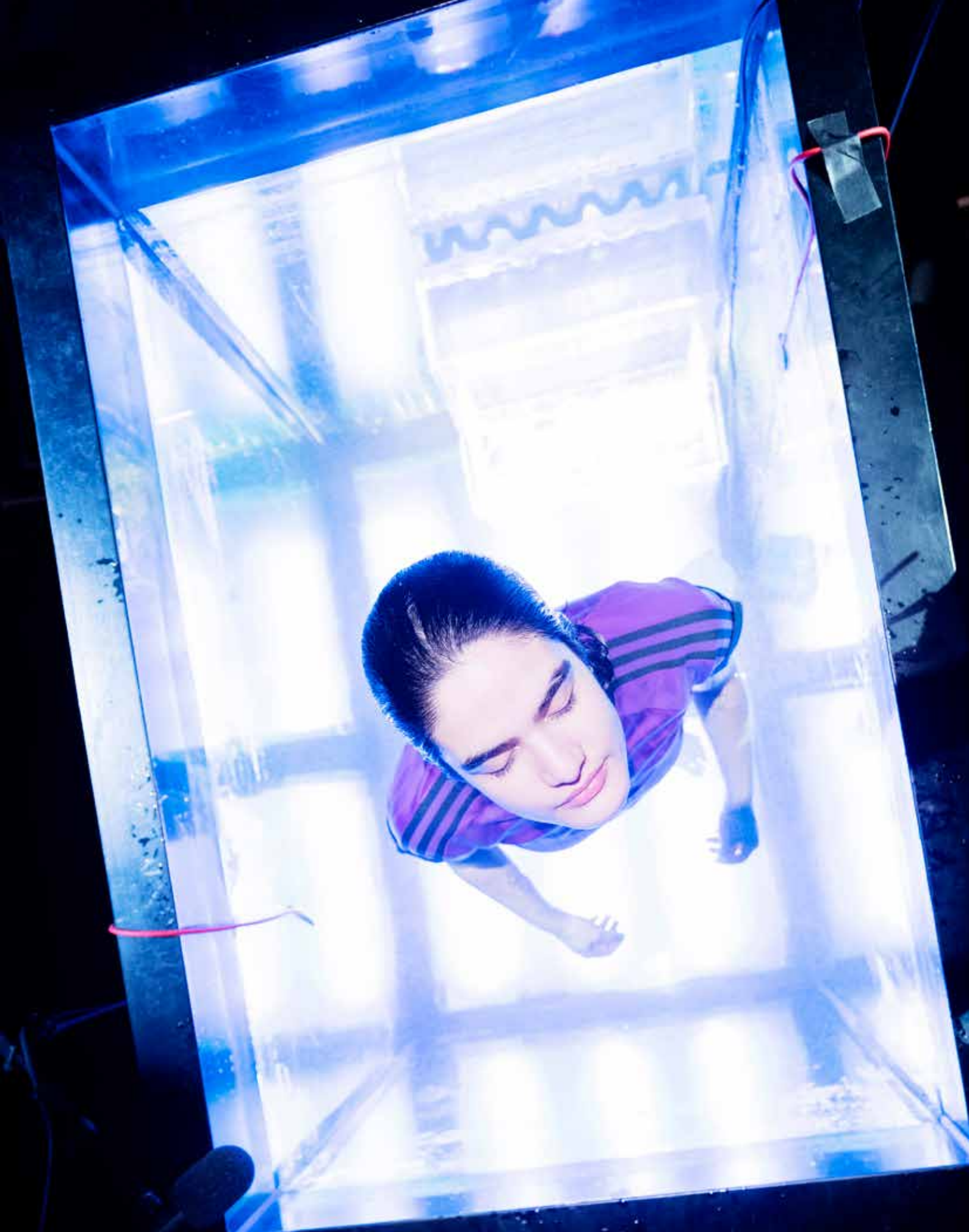
Krigerska på Backa Teater