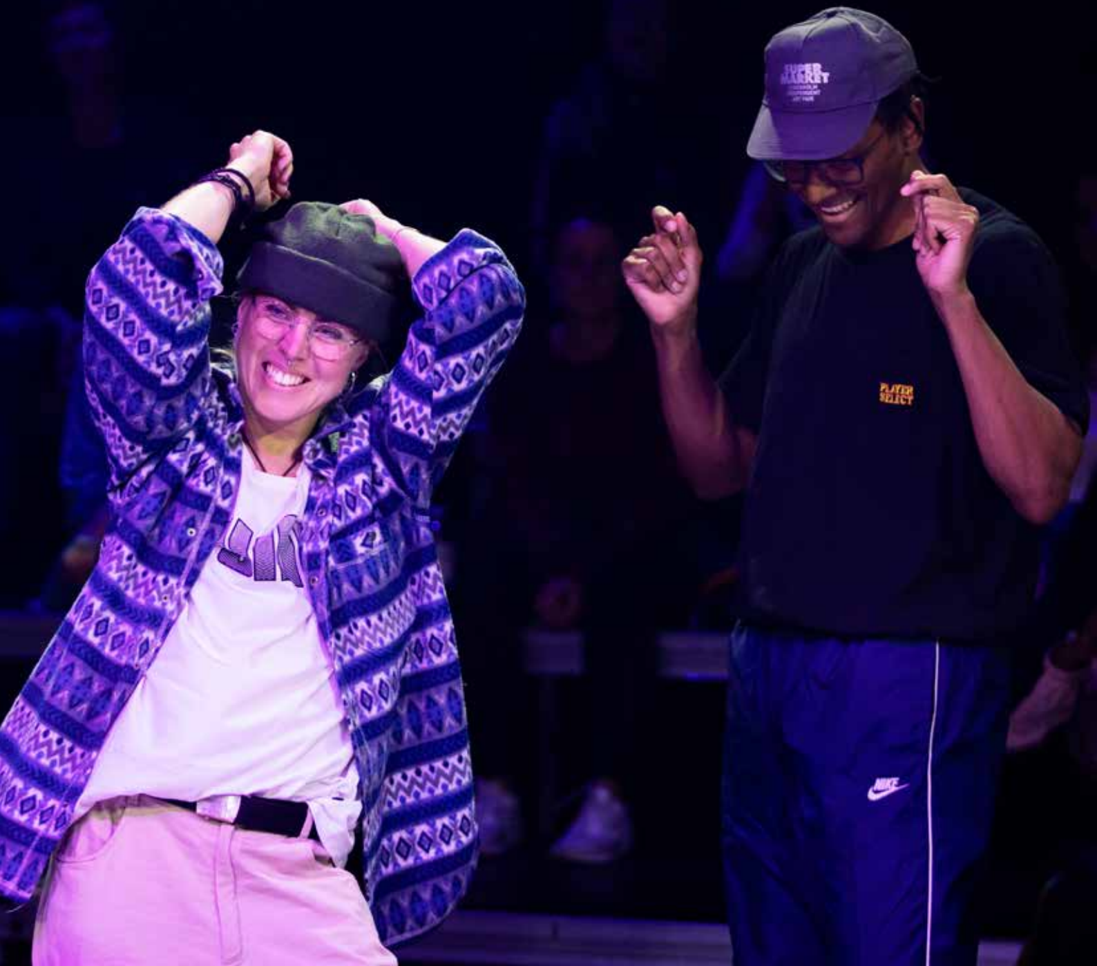
Up North på Norrlandsoperan Foto: Elin Berge (montage)