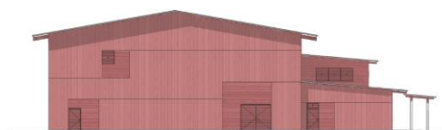
Fasad mot öster