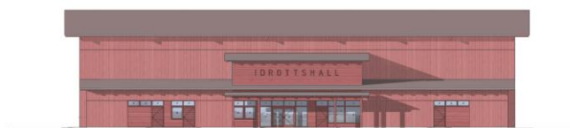
Fasad mot norr