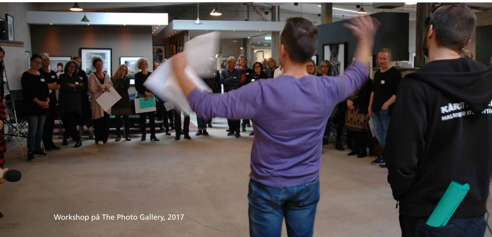
Workshop på The Photo Gallery, 2017

Tre Halmstadbor tycker till, ur kulturenkäten 2018.