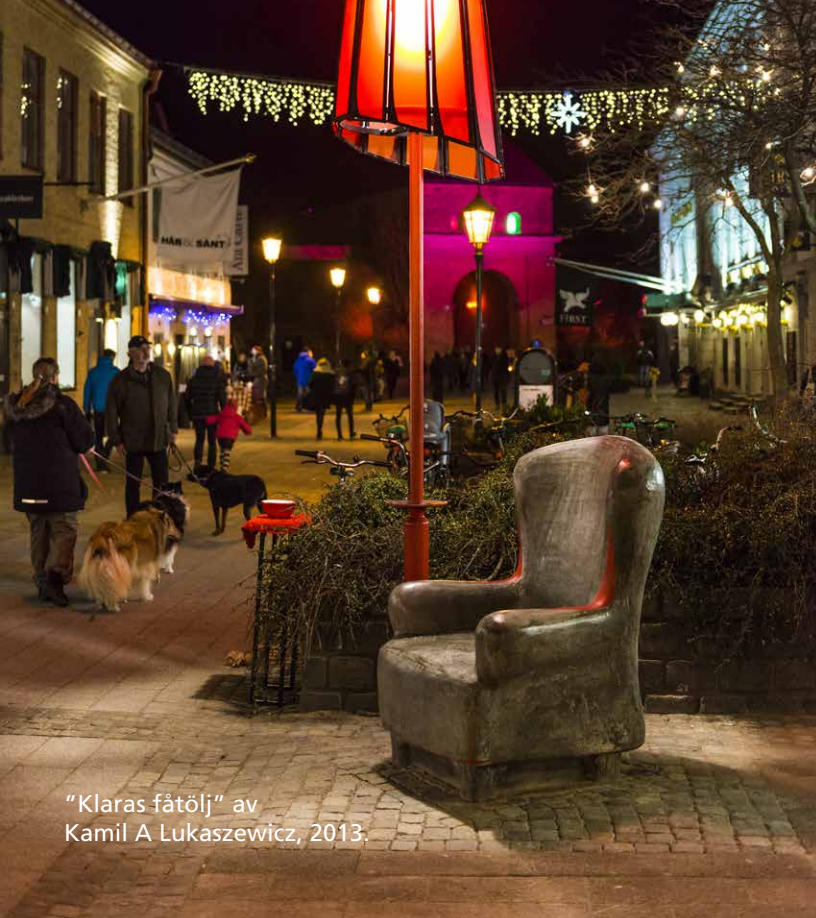
“Klaras fätölj” av Kamil A Lukaszewicz, 2013.

Våga ta ut svängarna och gör något som inga andra städer vågat eller har gjort än.