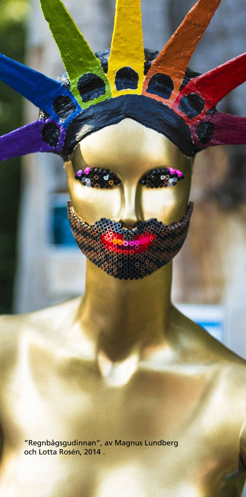
"Regnbågsgudinnan", av Magnus Lundberg och Lotta Rosén, 2014 .

Var lite uppfinningsrika och innovativa. Det innebär inte berg- och dalbanor på torget, eller att det finns två miljarder matstånd i stan under en dag.