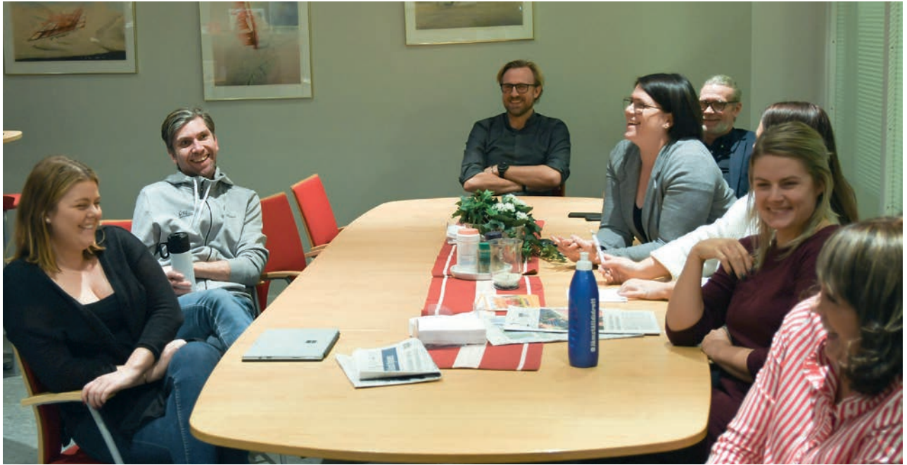
Glada miner och stenhård fokus när 2018 års folkbildningsverksamhet summerades.