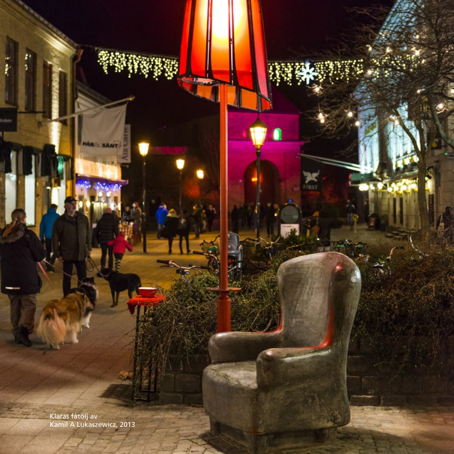
Klaras fátölj av Kamil A Lukaszewicz, 2013