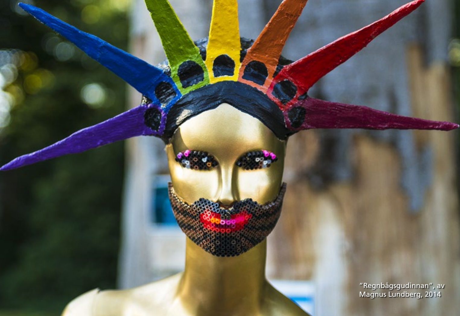
”Regnbågsgudinnan”, av Magnus Lundberg, 2014.