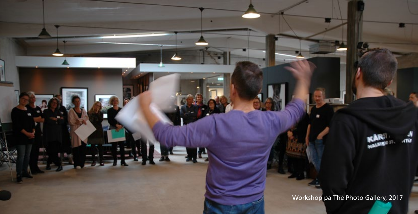
Workshop på The Photo Gallery, 2017