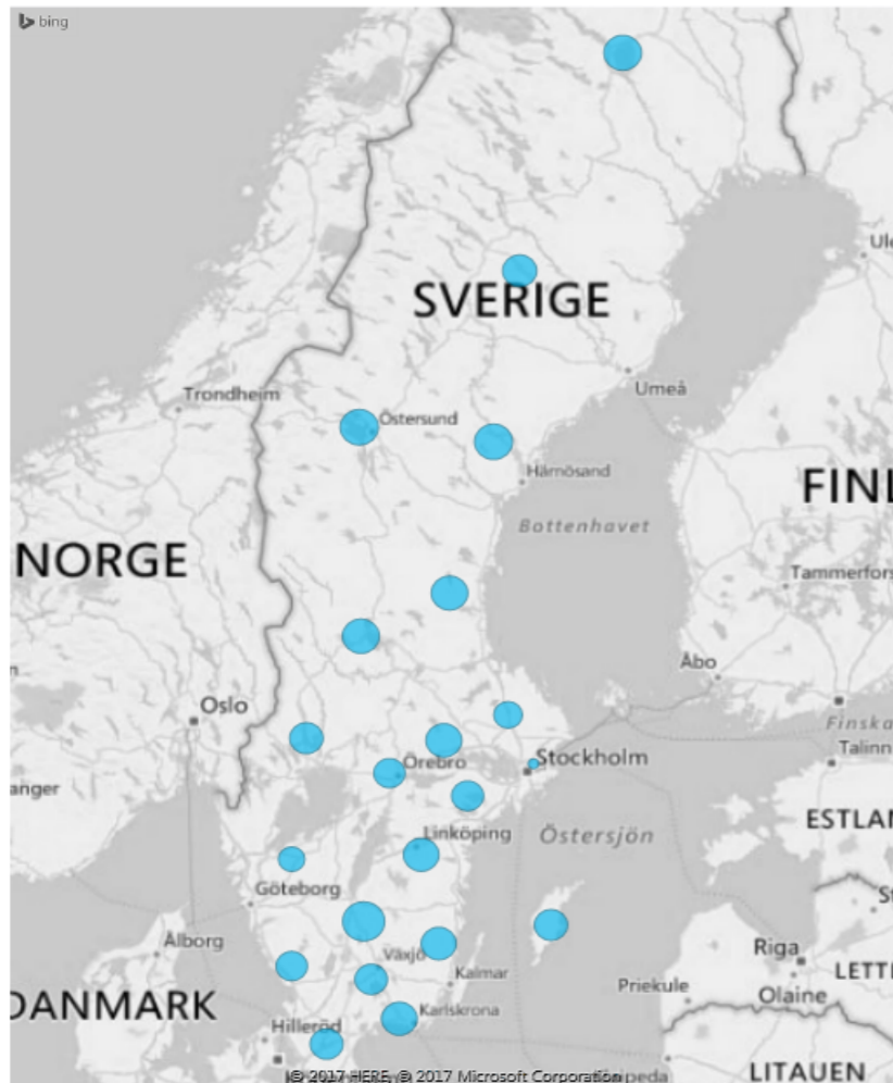
Netto efter Län