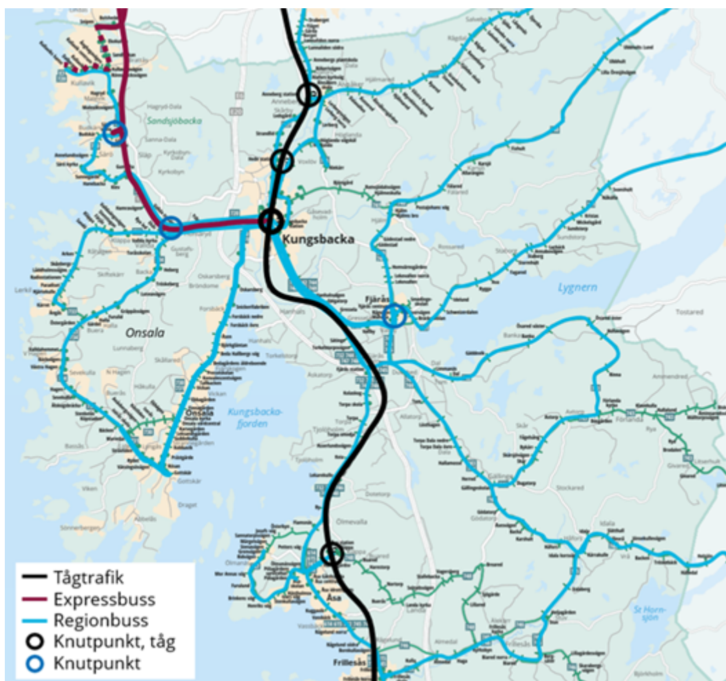
Figur 2. Översikt av framtaget trafikeringsförslag, ett scenario med ny expressbusslinje till Kungsbacka.

Det starka stråket mellan Fjärås och Kungsbacka förstärks med en robust busslinje med högt utbud mellan dessa orter. Flera busslinjer föreslås mötas vid Fjärås centrum, vilket utvecklas till en viktig knutpunkt i systemet.